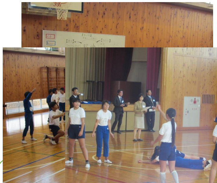
のイメージを作り上げることができました。本時のめあては、「動きの工夫く・小さく」「終わり（3秒止まる）」と明示されていました。